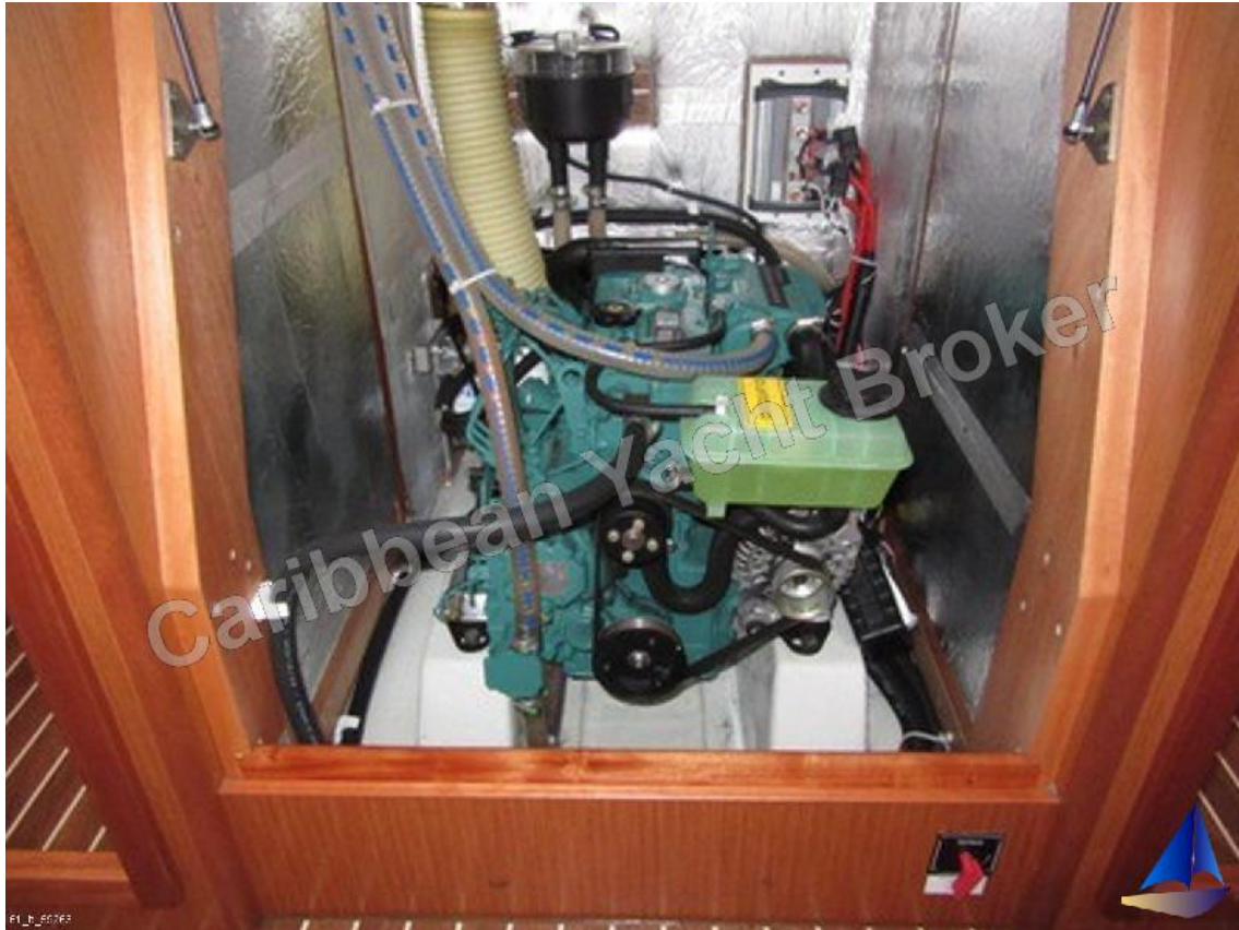
Layout / Bavaria Cruiser 37 - 2016