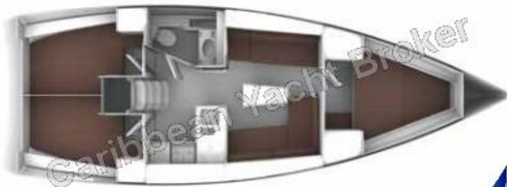
Layout / Bavaria Cruiser 37 - 2016