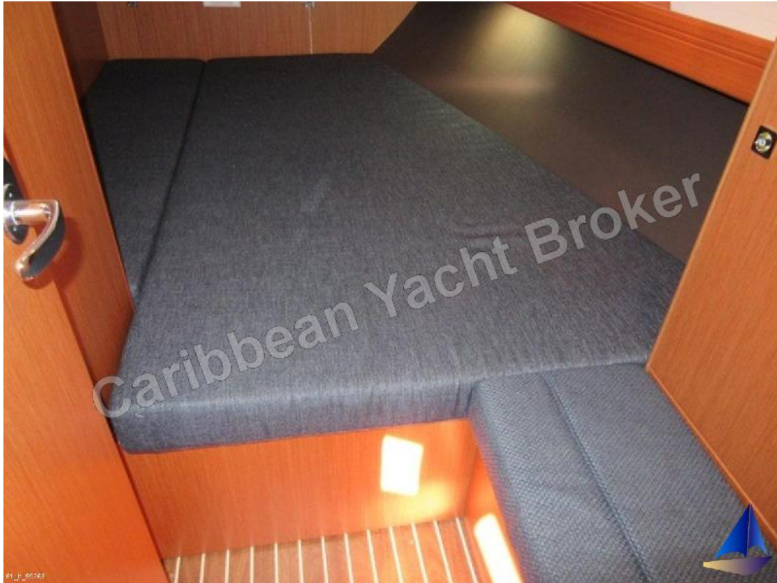
Cabin / Bavaria Cruiser 37 - 2016