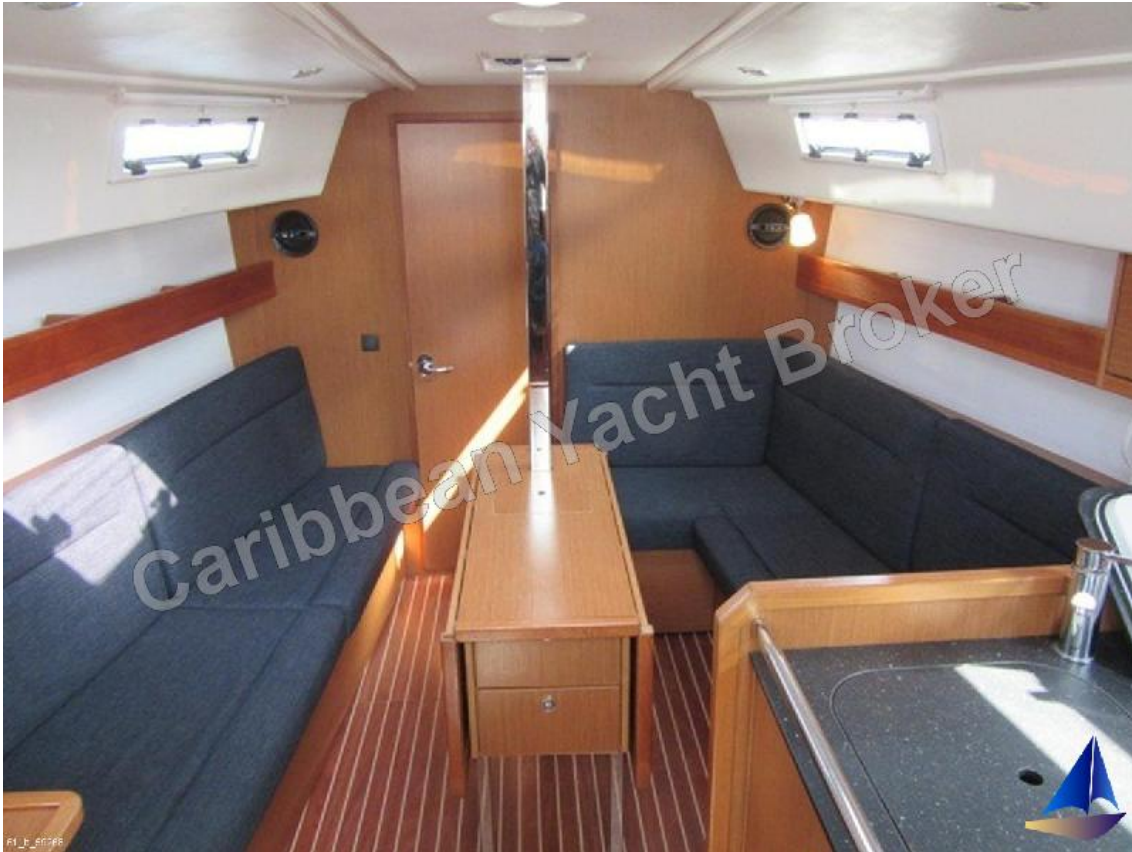
Navigation / Bavaria Cruiser 32 - 2012