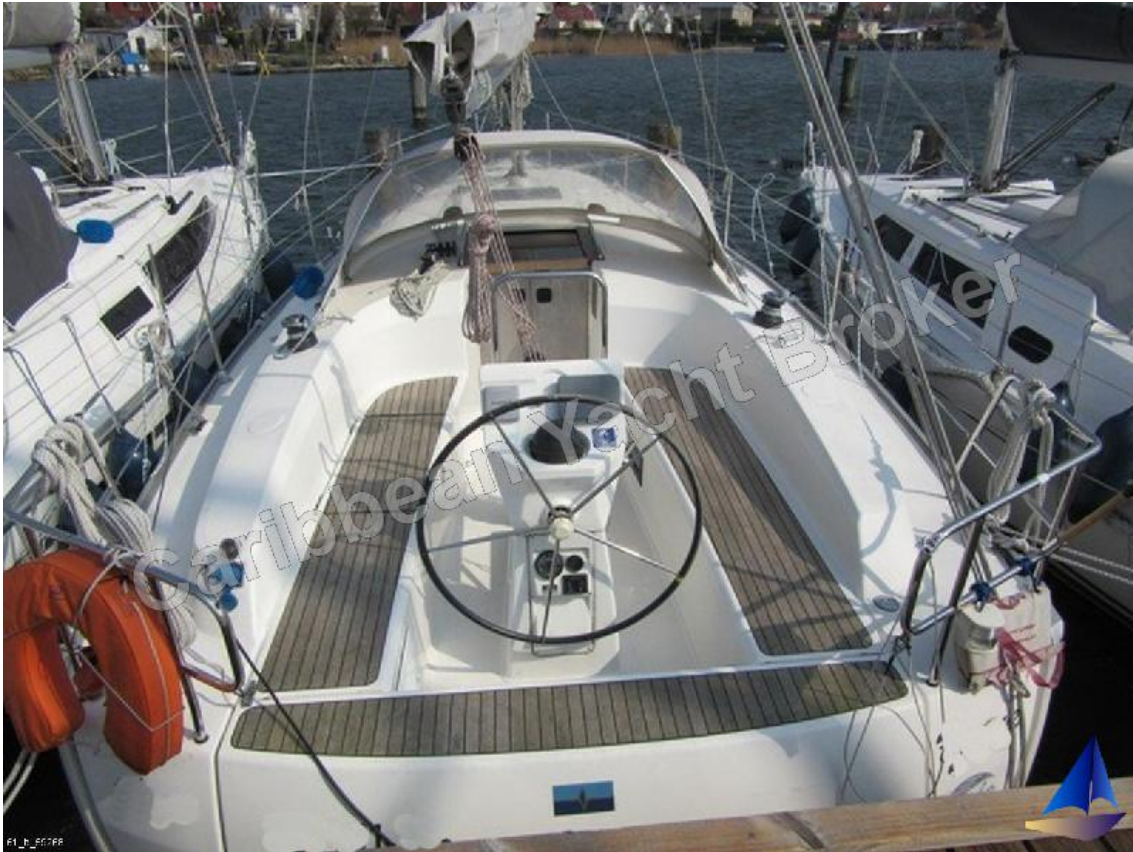
Bavaria Cruiser 32 - 2012