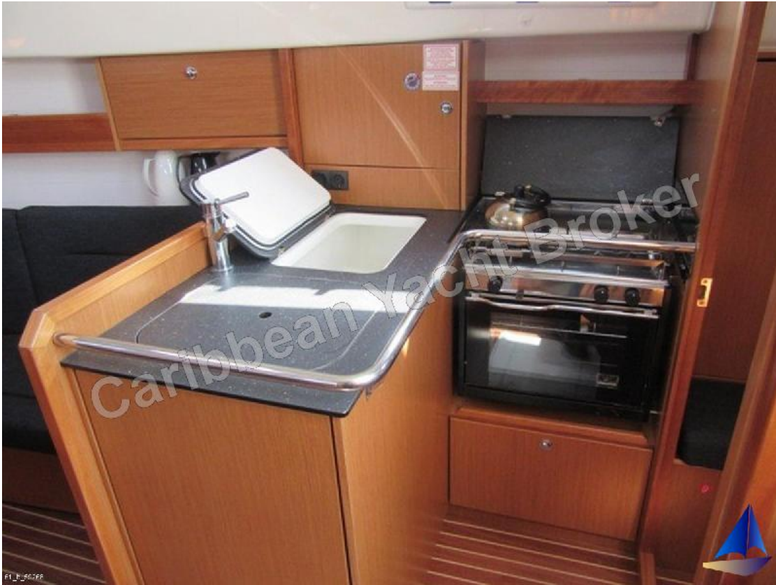
Cabin / Bavaria Cruiser 32 - 2012