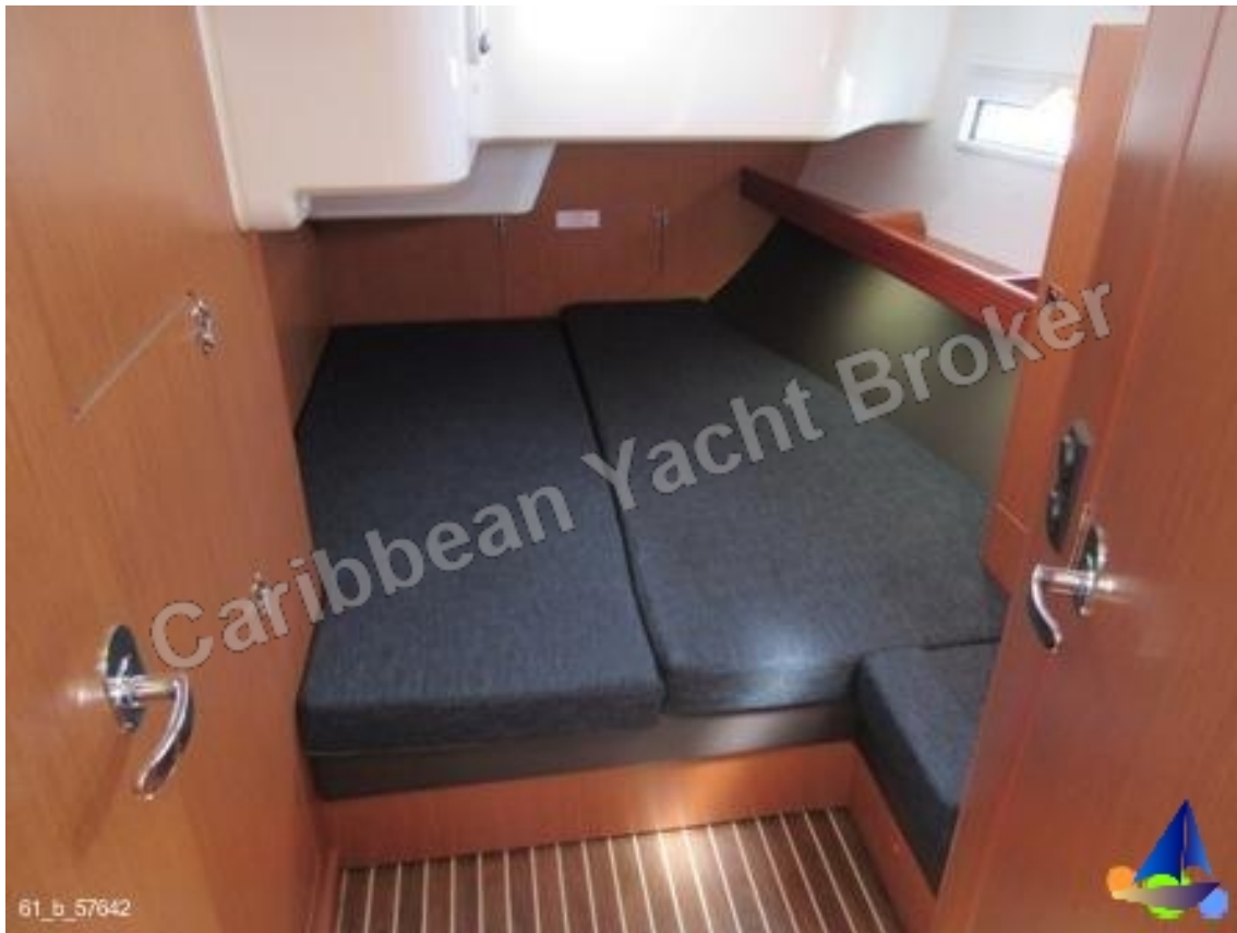
Bavaria Cruiser 51 - 2015