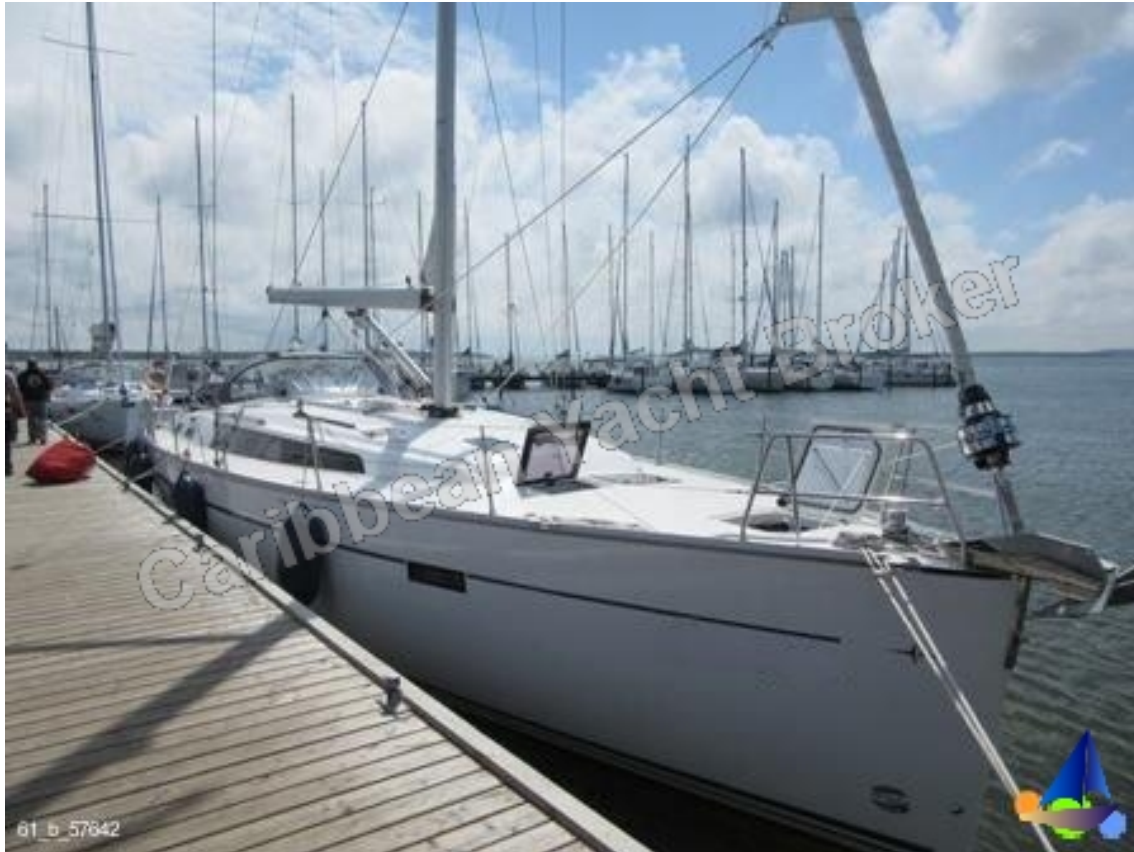
Bavaria Cruiser 51 - 2015