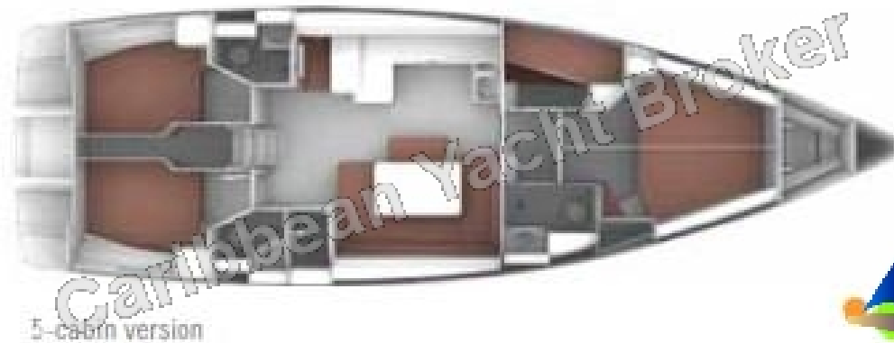
Bavaria Cruiser 51 - 2015