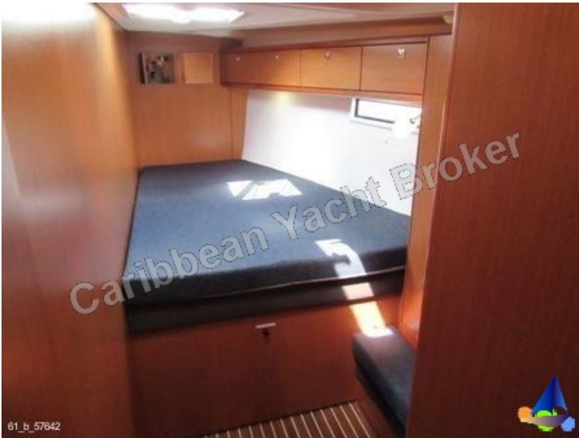
Bavaria Cruiser 51 - 2015