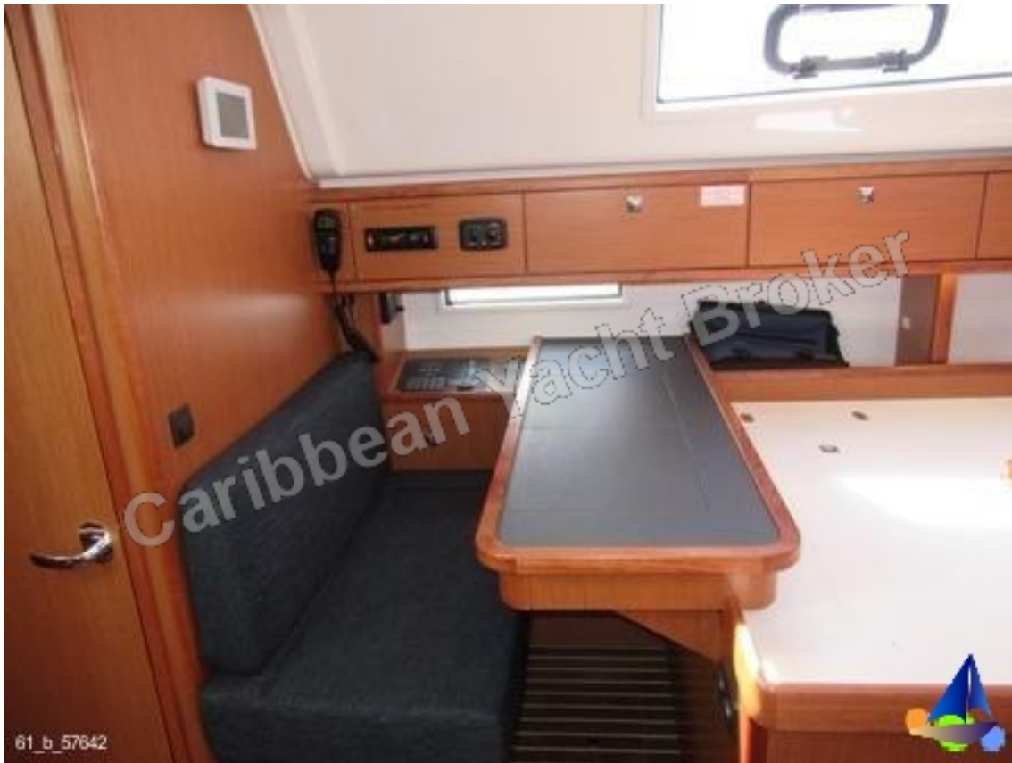
Bavaria Cruiser 51 - 2015