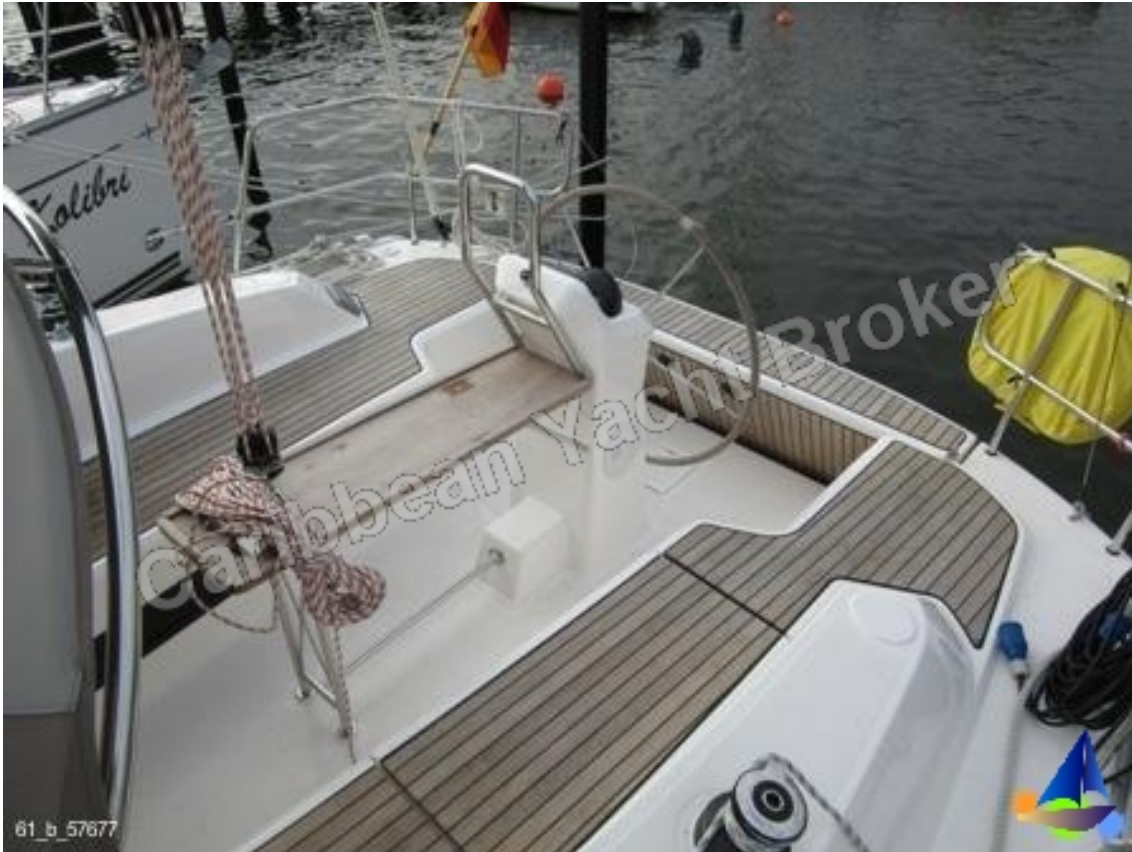
Bavaria Cruiser 33 - 2015