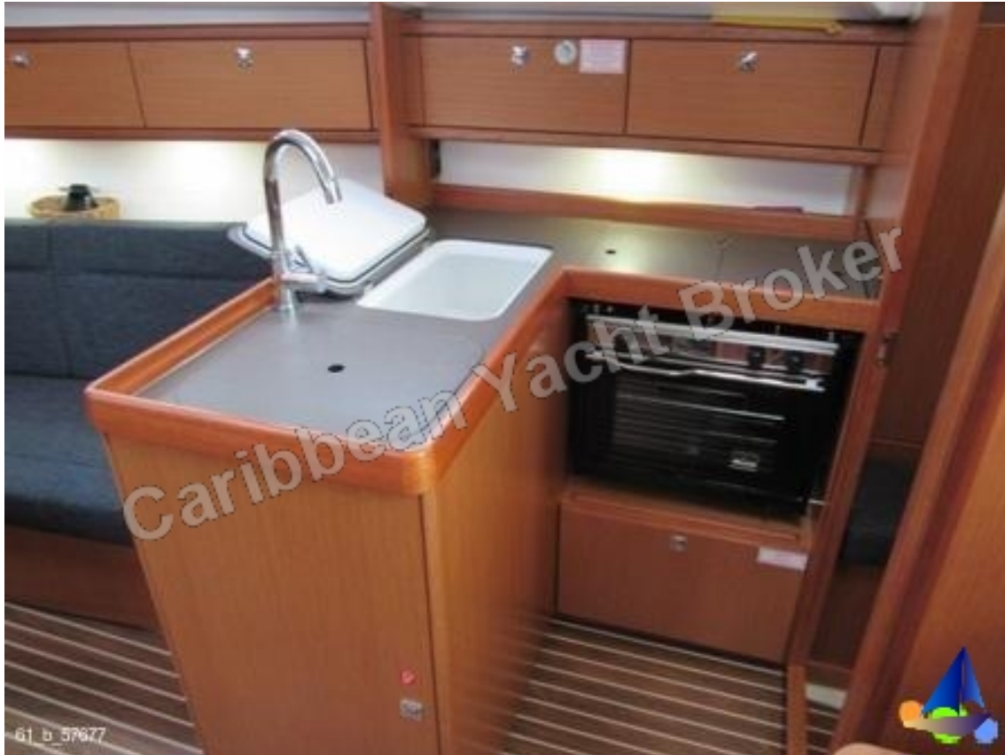
Bavaria Cruiser 33 - 2015