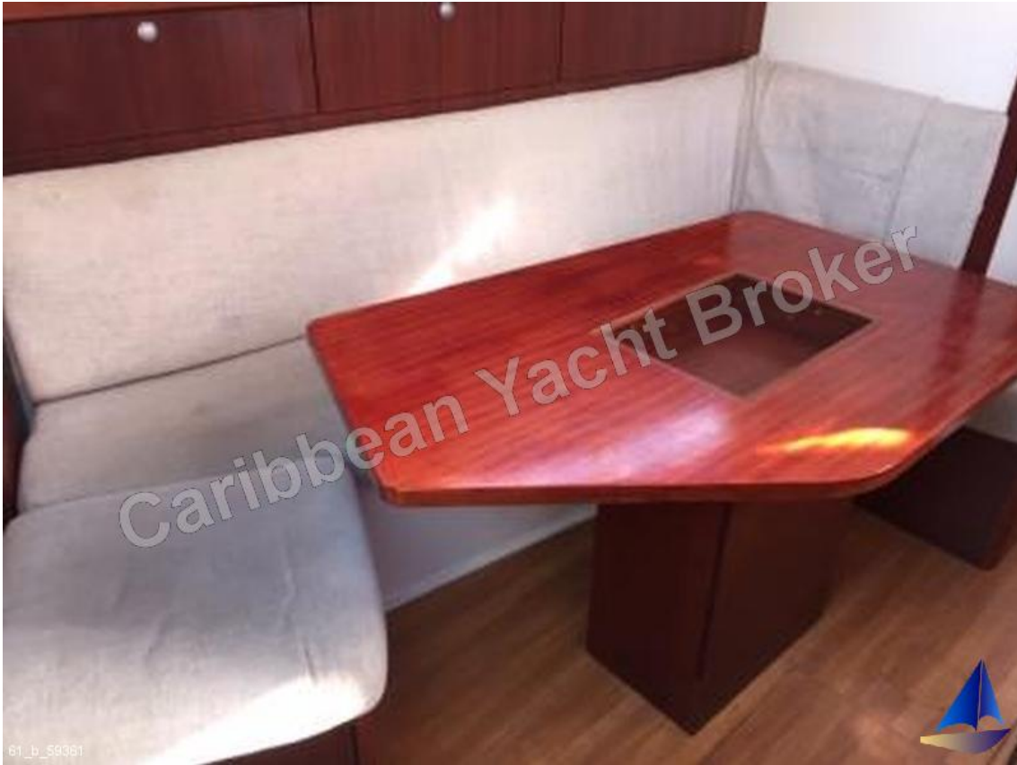
Hanse 350 - 2009