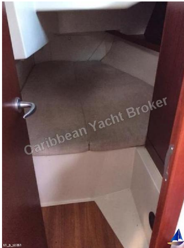
Hanse 350 - 2009