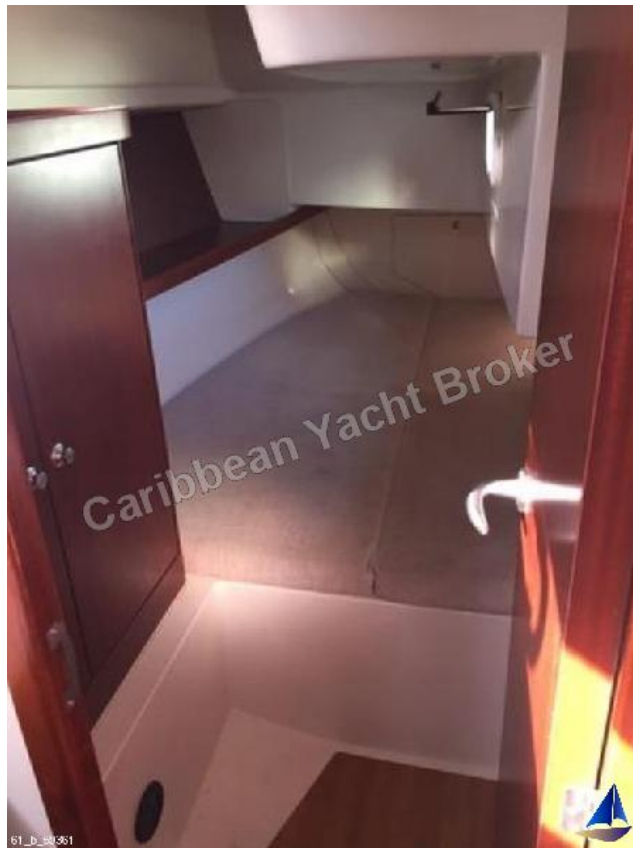
Hanse 350 - 2009