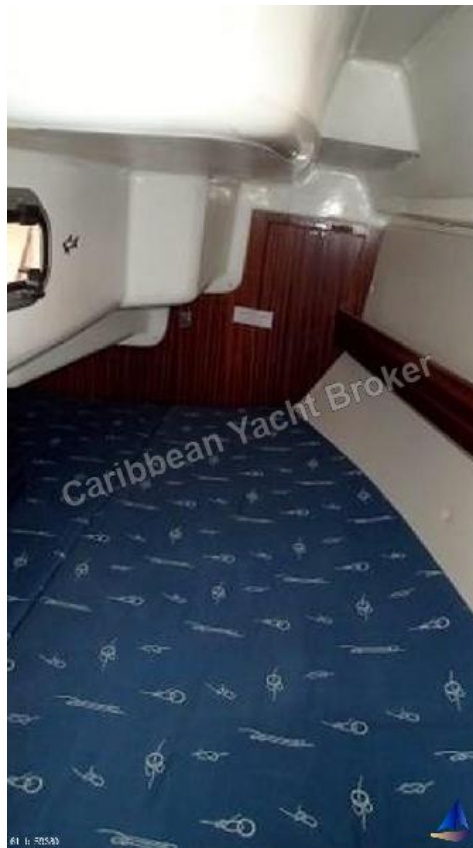
Bavaria 31 Cruiser - 1999