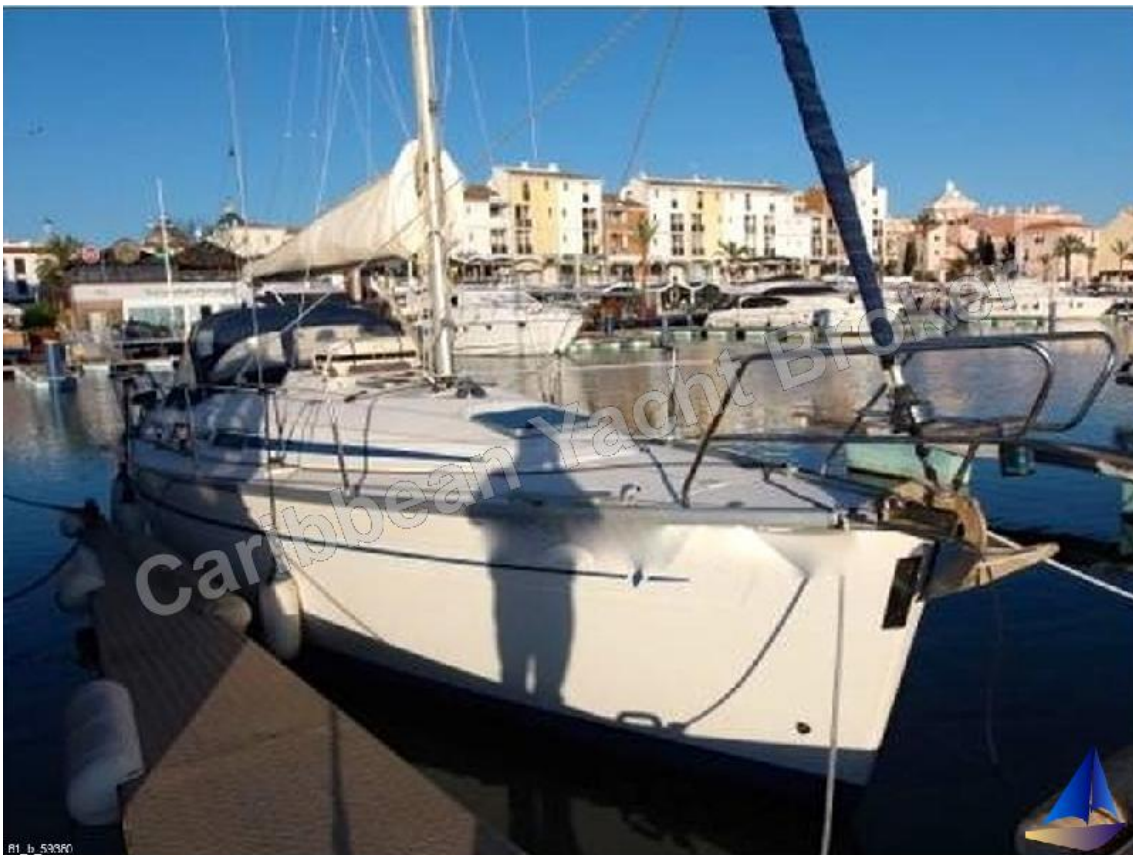
Bavaria 31 Cruiser - 1999