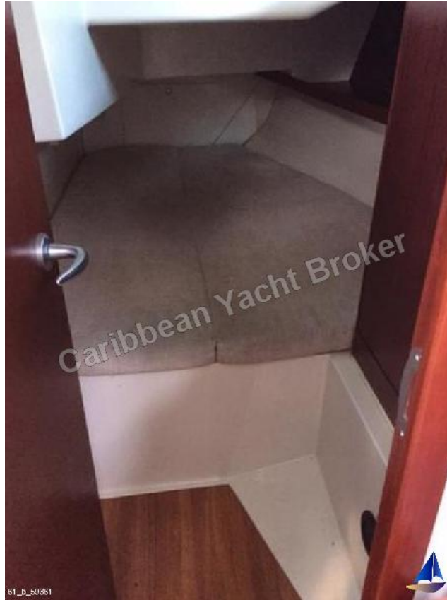
Hanse 350 - 2009