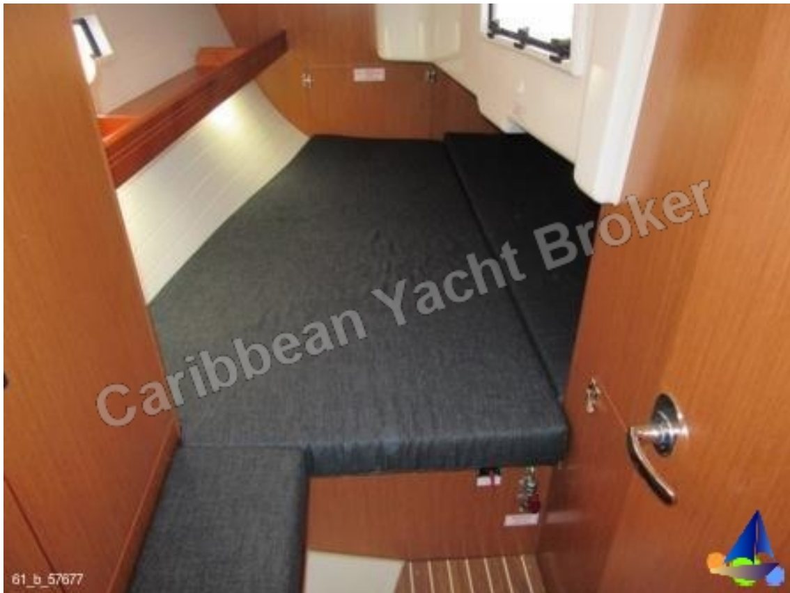
Bavaria Cruiser 33 - 2015