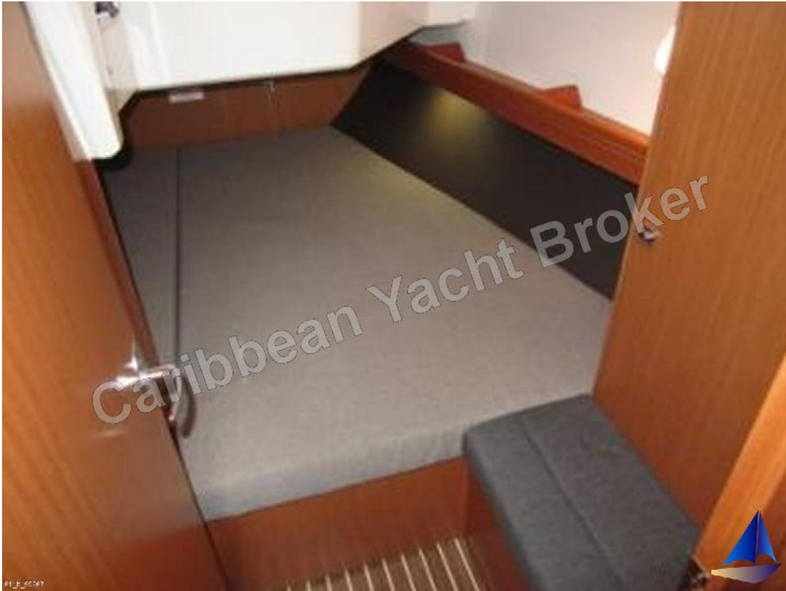
Layout / Bavaria Cruiser 37 - 2015