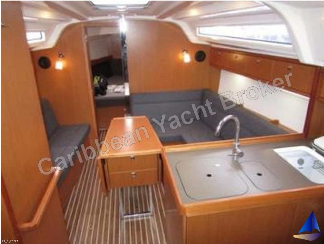
Galley / Bavaria Cruiser 37 - 2015