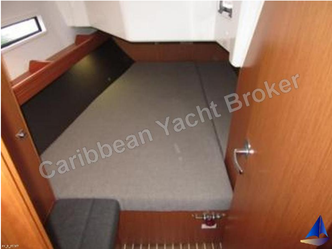
Cabin / Bavaria Cruiser 37 - 2015