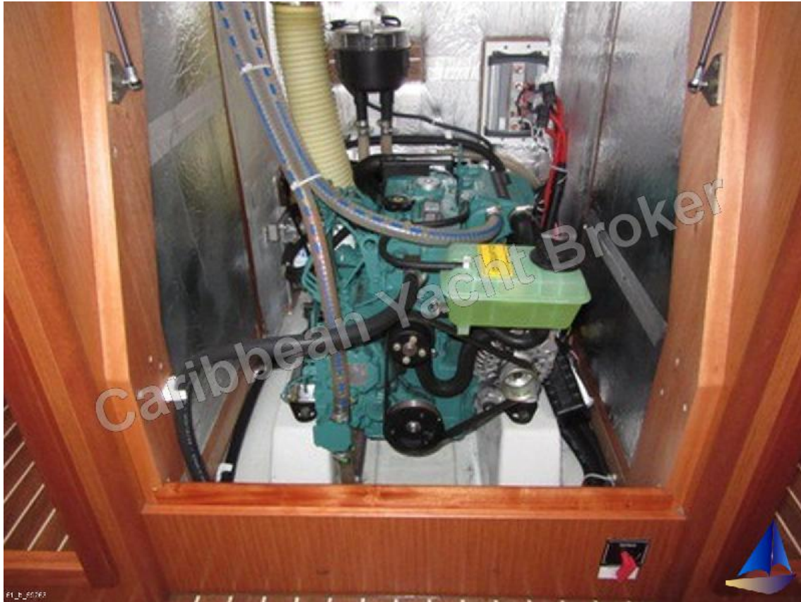
Layout / Bavaria Cruiser 37 - 2016