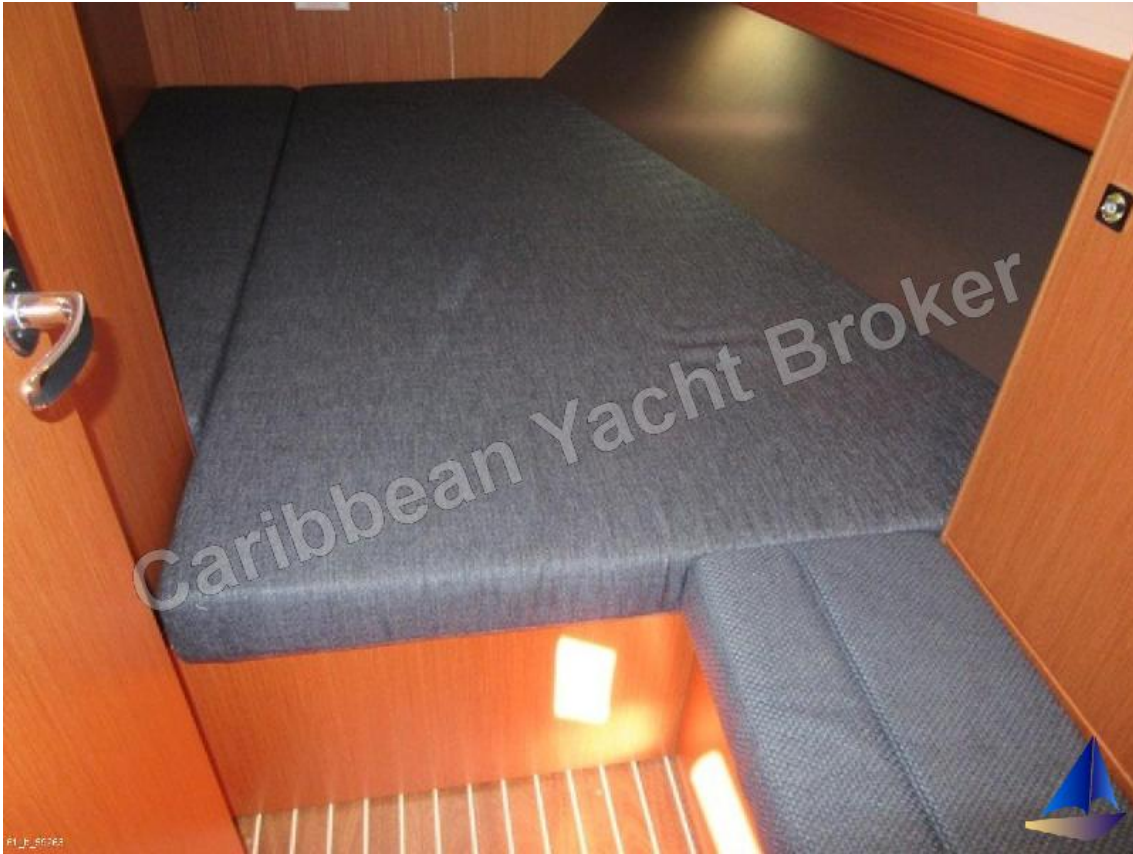
Cabin / Bavaria Cruiser 37 - 2016