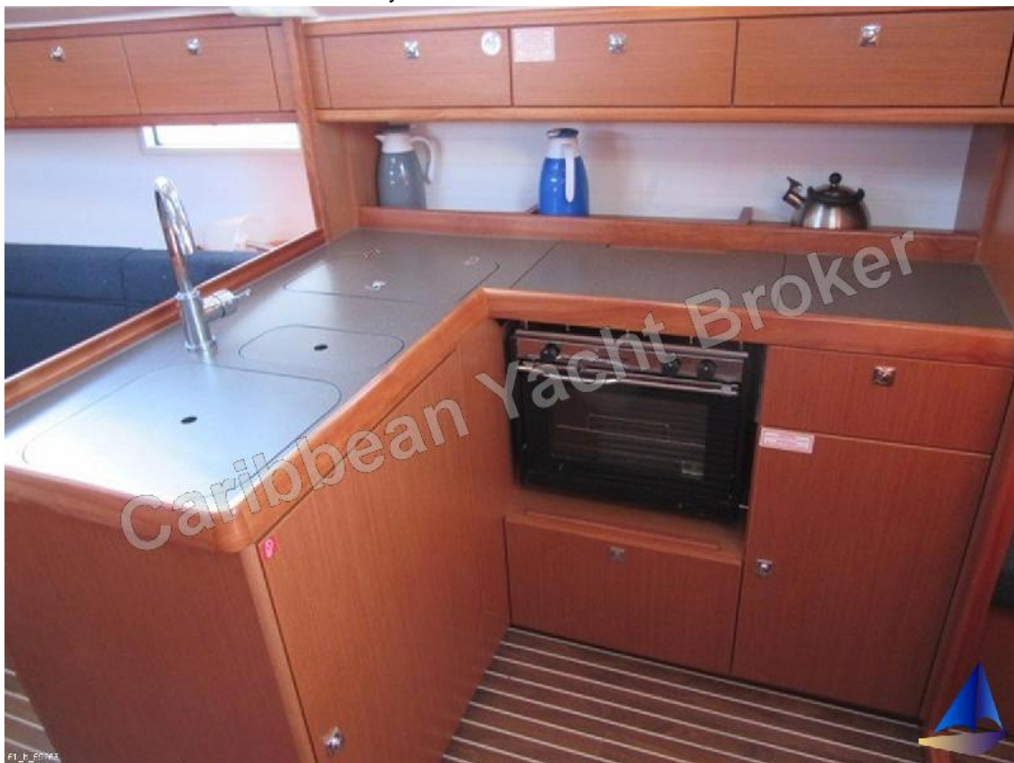
Navigation / Bavaria Cruiser 37 - 2016