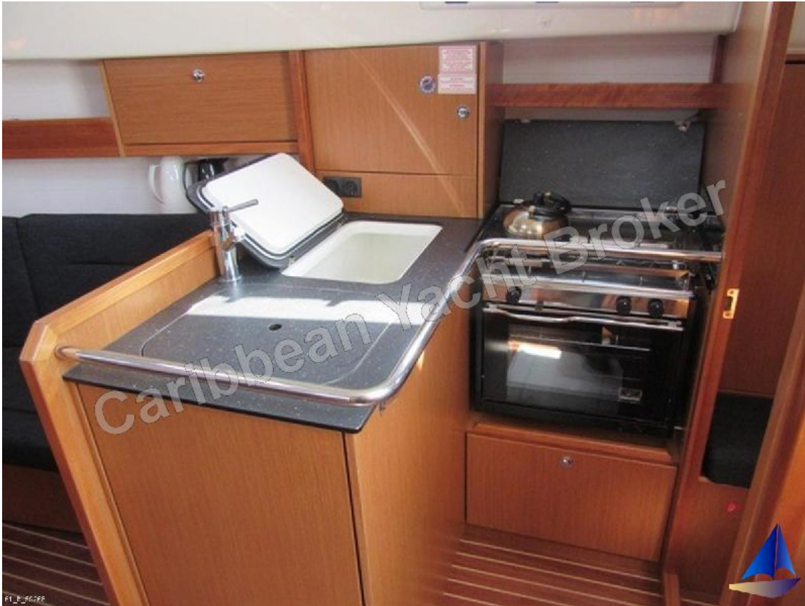
Cabin / Bavaria Cruiser 32 - 2012