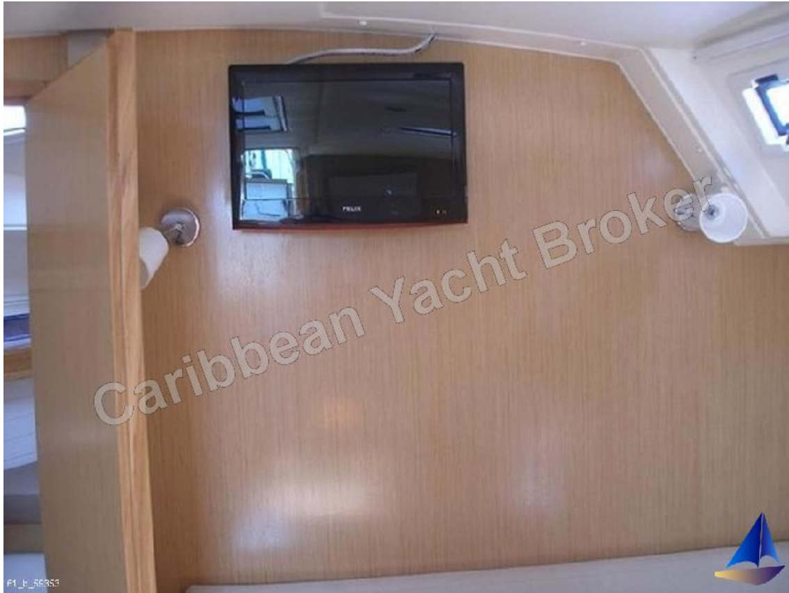
Cabin / Bavaria Cruiser 40 - 2011