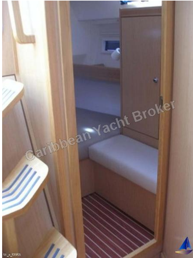
Bath / Toilet / Bavaria Cruiser 40 - 2011