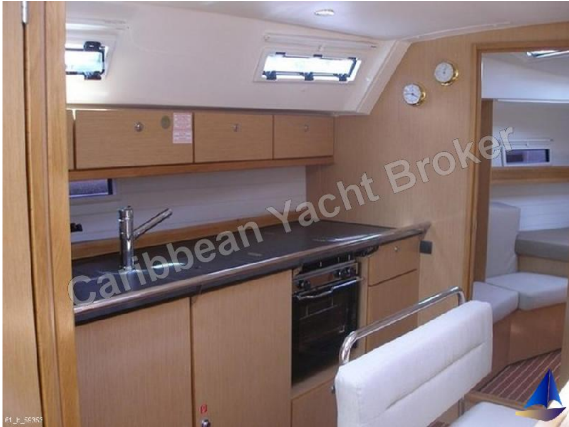
Navigation / Bavaria Cruiser 40 - 2011