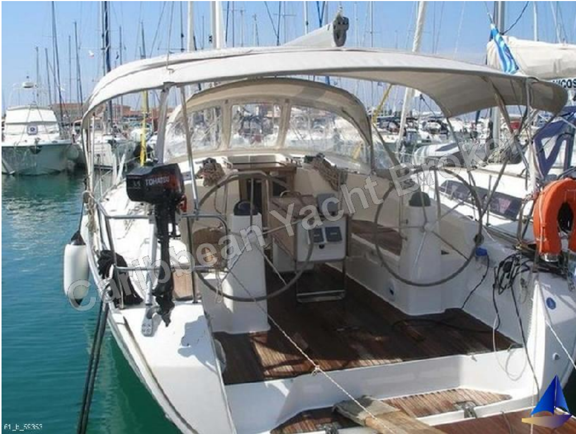
Salon / Bavaria Cruiser 40 - 2011