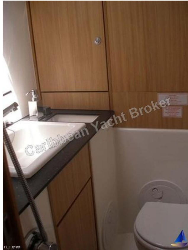
Layout / Bavaria Cruiser 40 - 2011