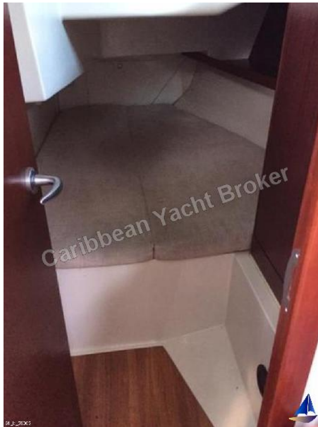
Bath / Toilet / Hanse 350 - 2009