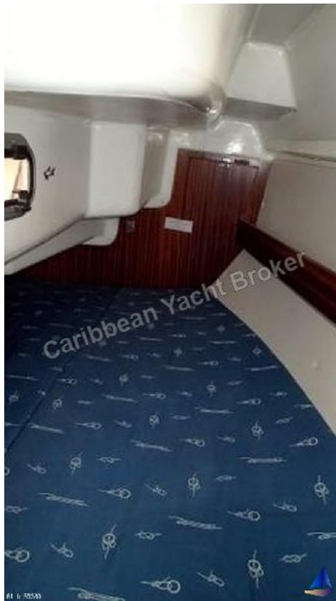
Bavaria 31 Cruiser - 1999