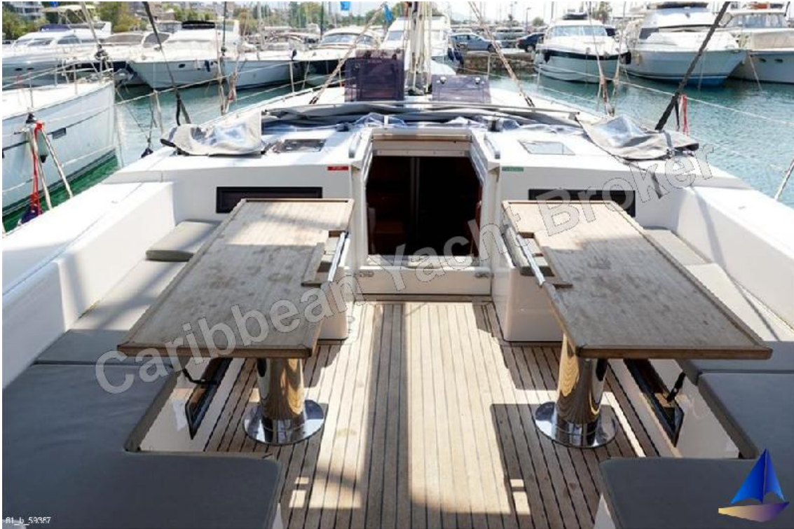
Cockpit / Bavaria C 57 - 2019