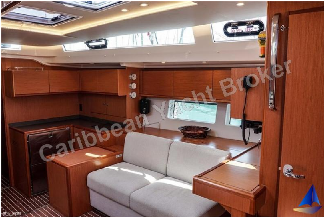
Cabin / Bavaria C 57 - 2019