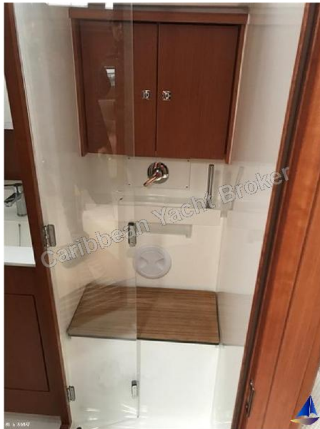
Bath / Toilet / Bavaria C 57 - 2019