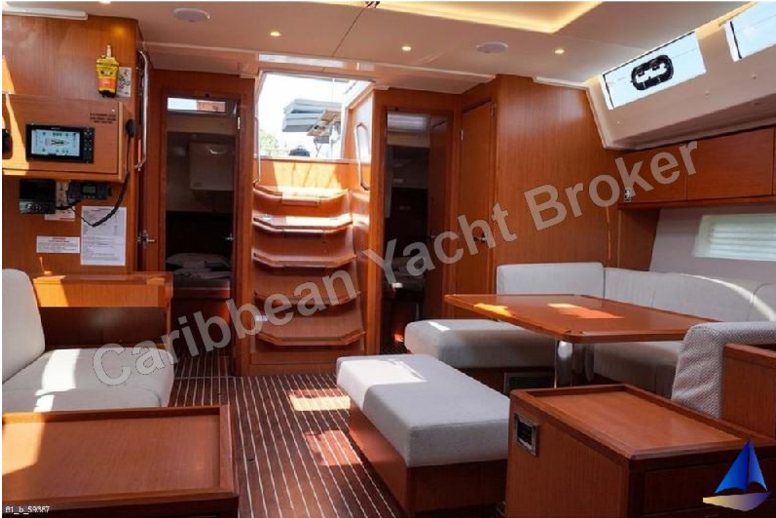
Salon / Bavaria C 57 - 2019