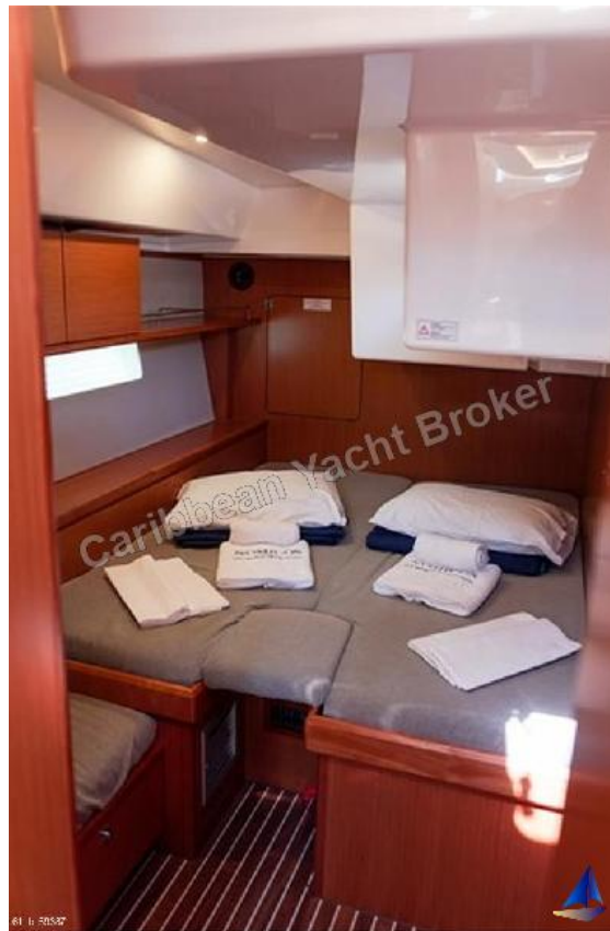
Cabin / Bavaria C 57 - 2019