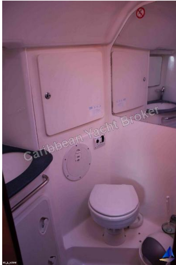
Layout / Bavaria 36 - 2005