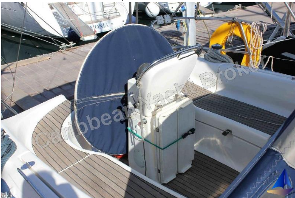
Deck / Bavaria 36 - 2005