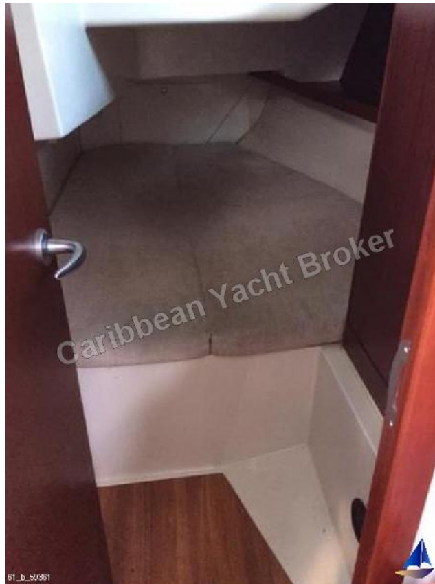
Hanse 350 - 2009