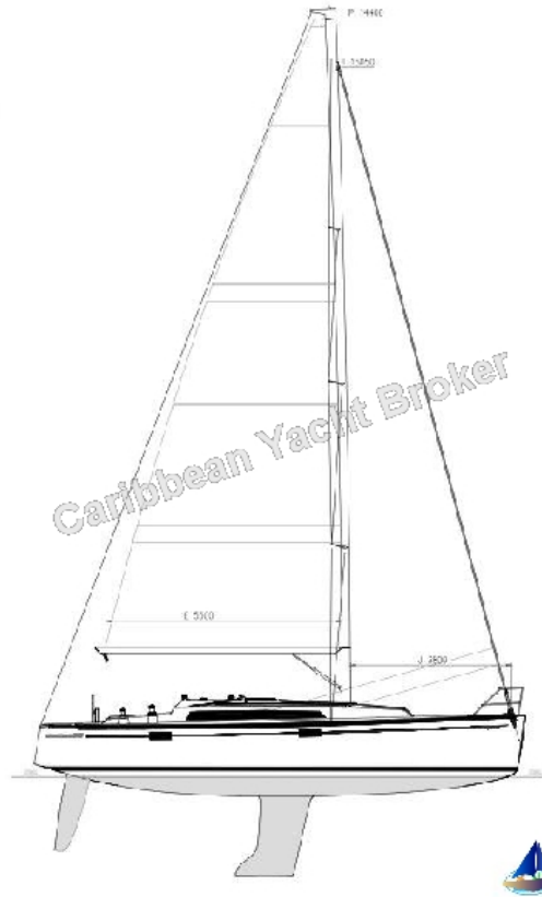
Layout / Salona 38 - 2008