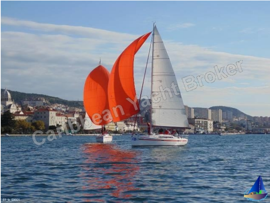
Salon / Salona 38 - 2008