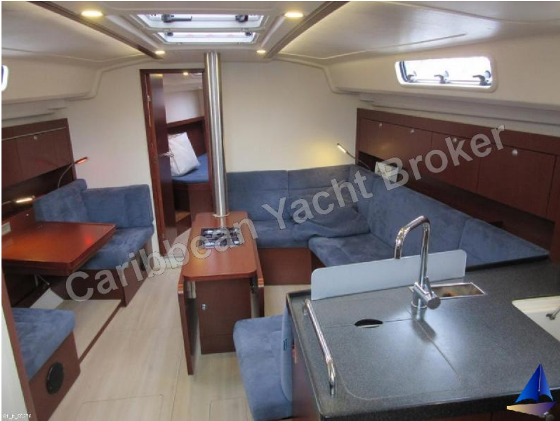
Galley / Hanse 415 - 2015