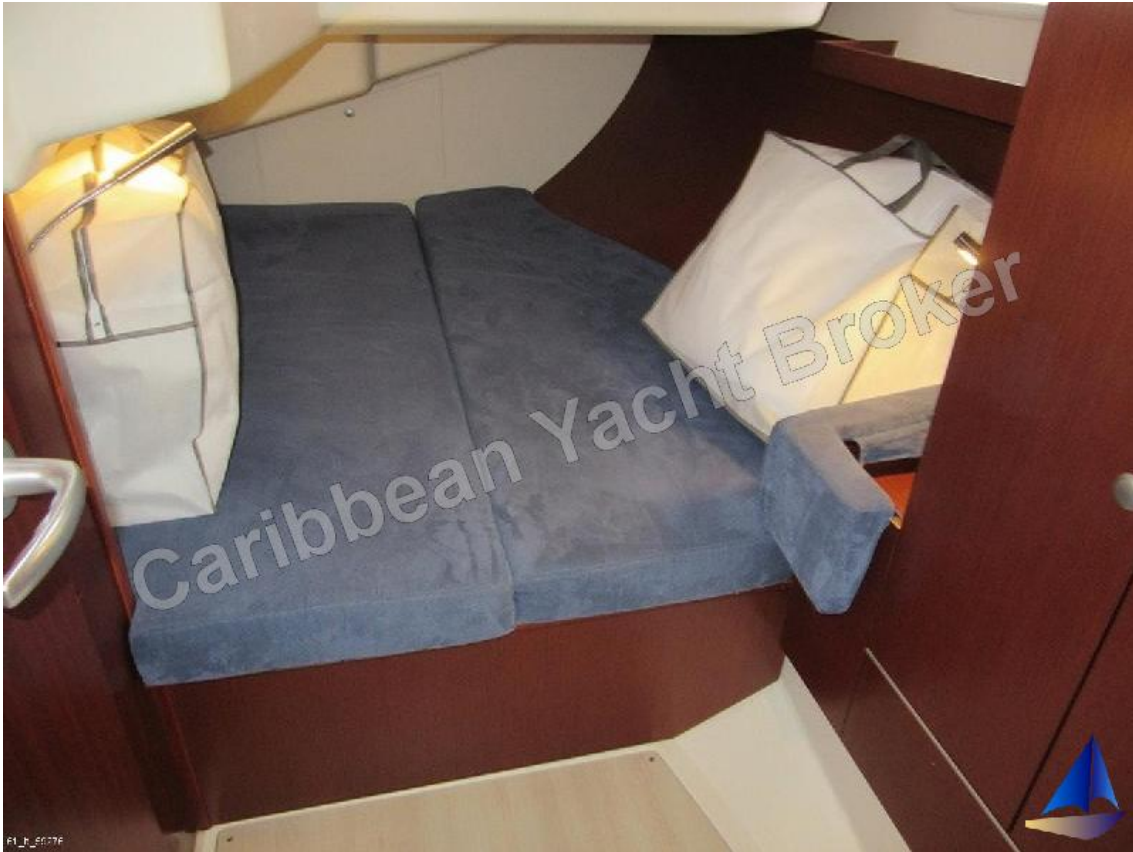
Cabin / Hanse 415 - 2015