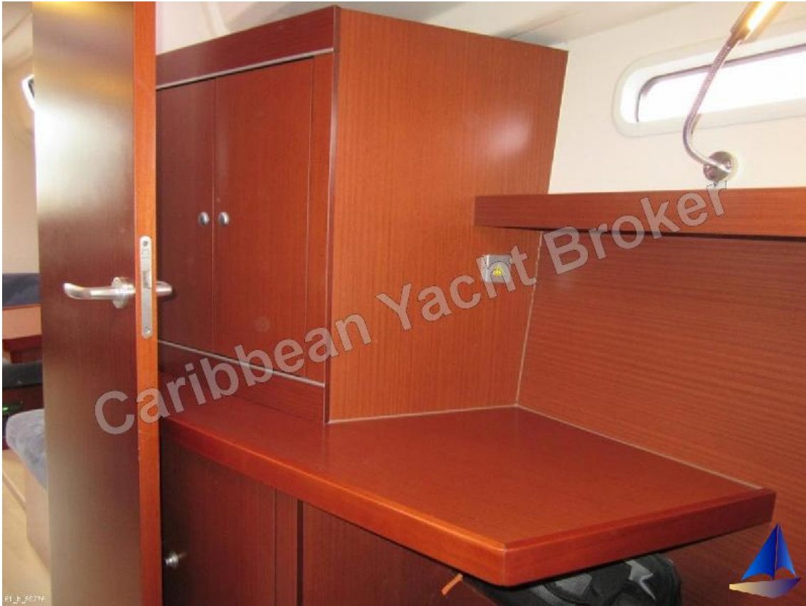
Cabin / Hanse 415 - 2015