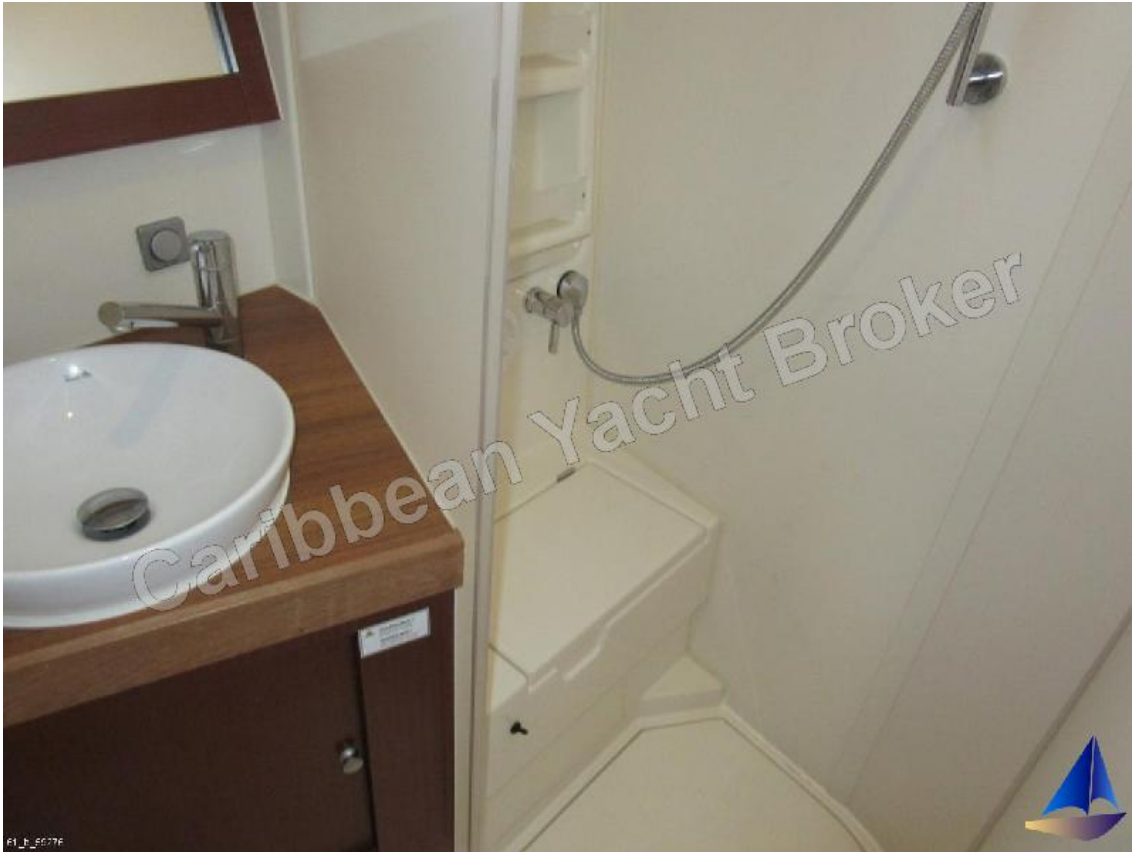
Bath / Toilet / Hanse 415 - 2015