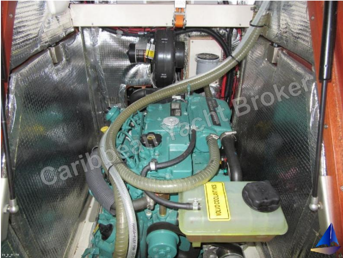
Layout / Hanse 415 - 2015