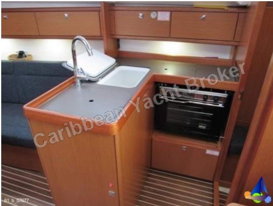
Bavaria Cruiser 33 - 2015