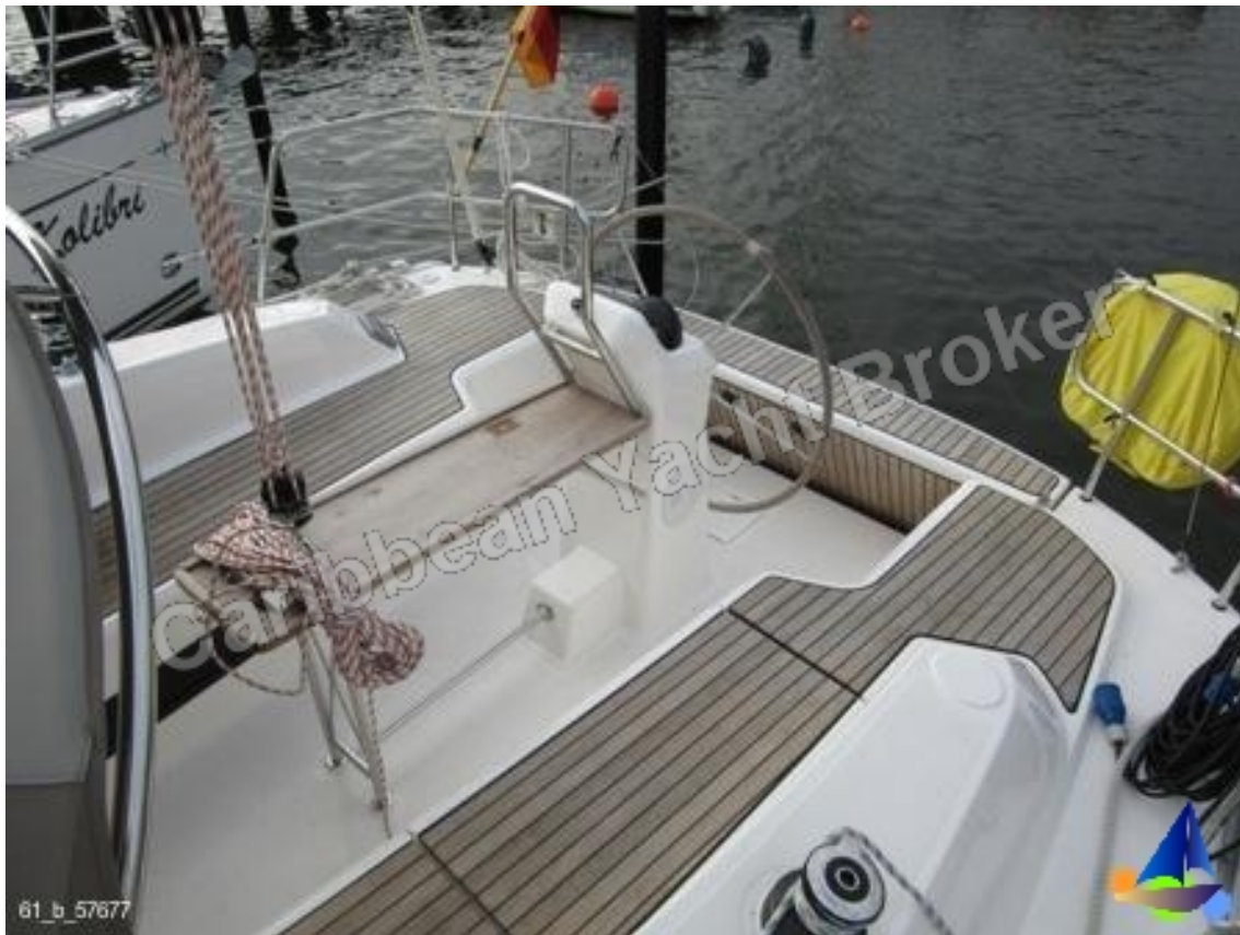
Bavaria Cruiser 33 - 2015