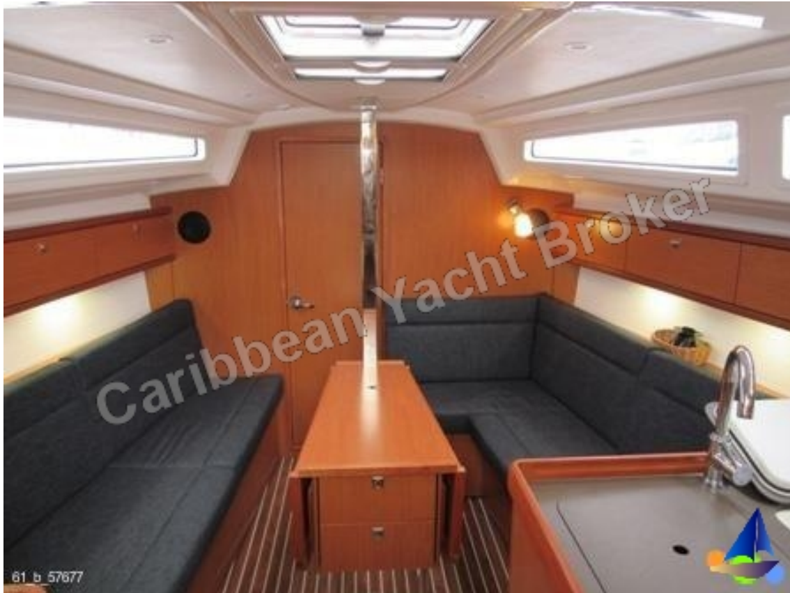
Bavaria Cruiser 33 - 2015