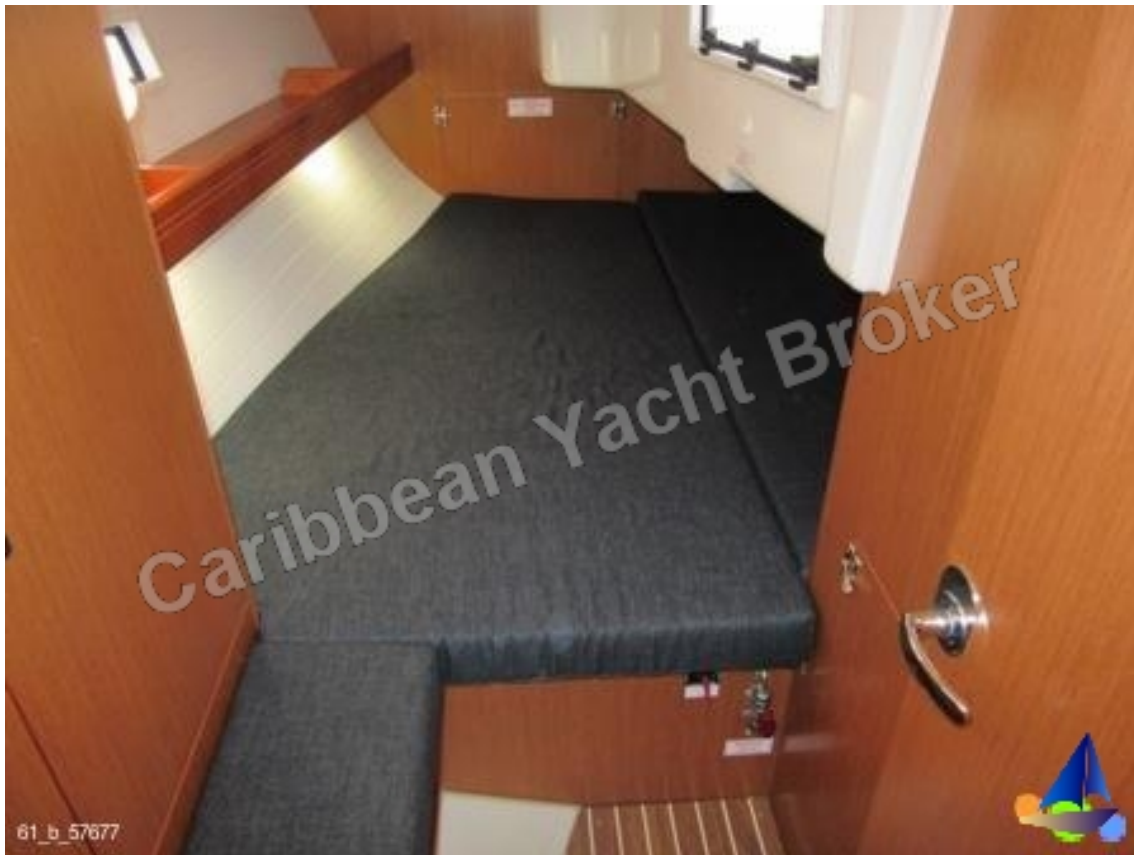
Bavaria Cruiser 33 - 2015