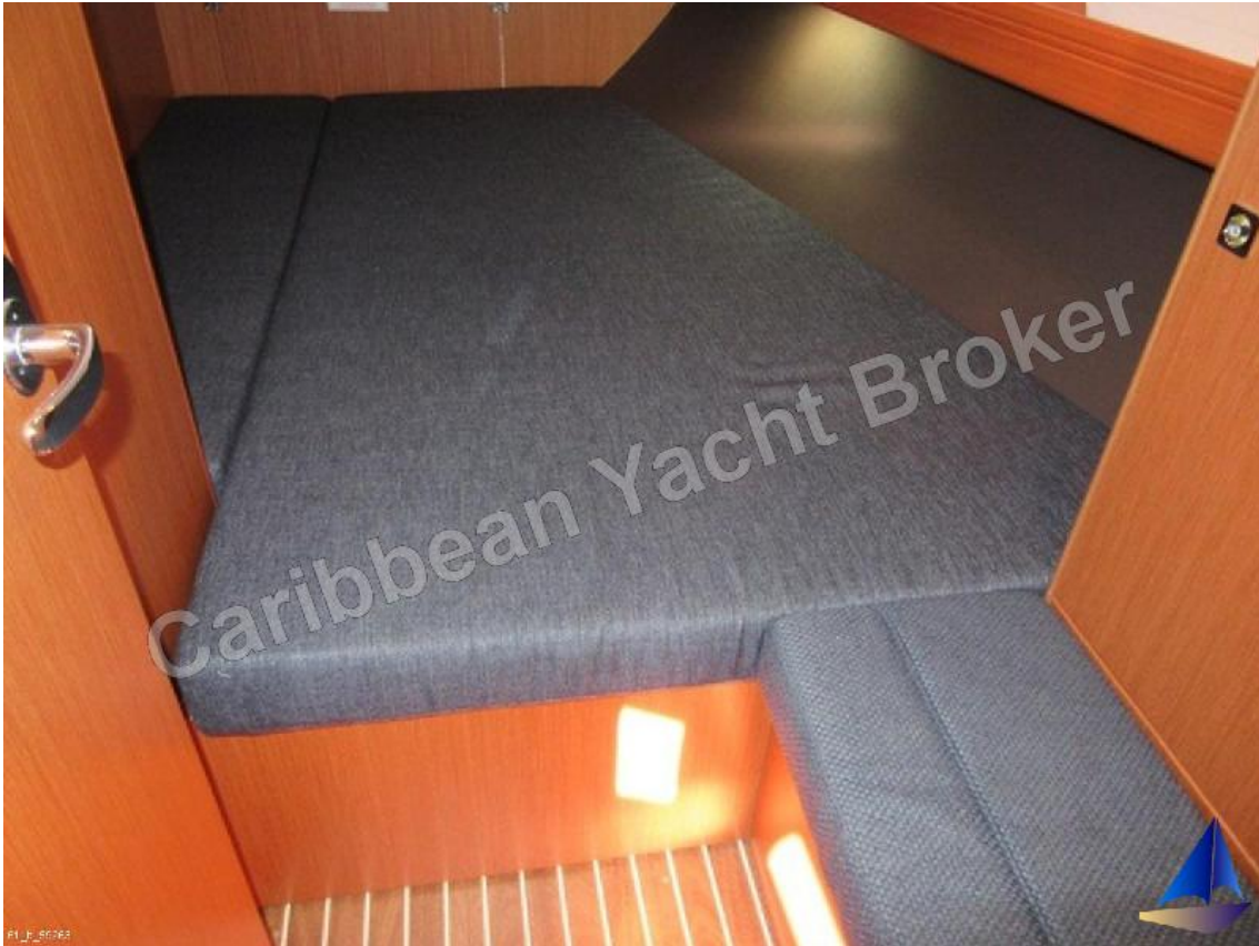
Cabin / Bavaria Cruiser 37 - 2016