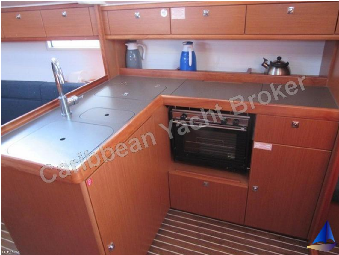
Navigation / Bavaria Cruiser 37 - 2016