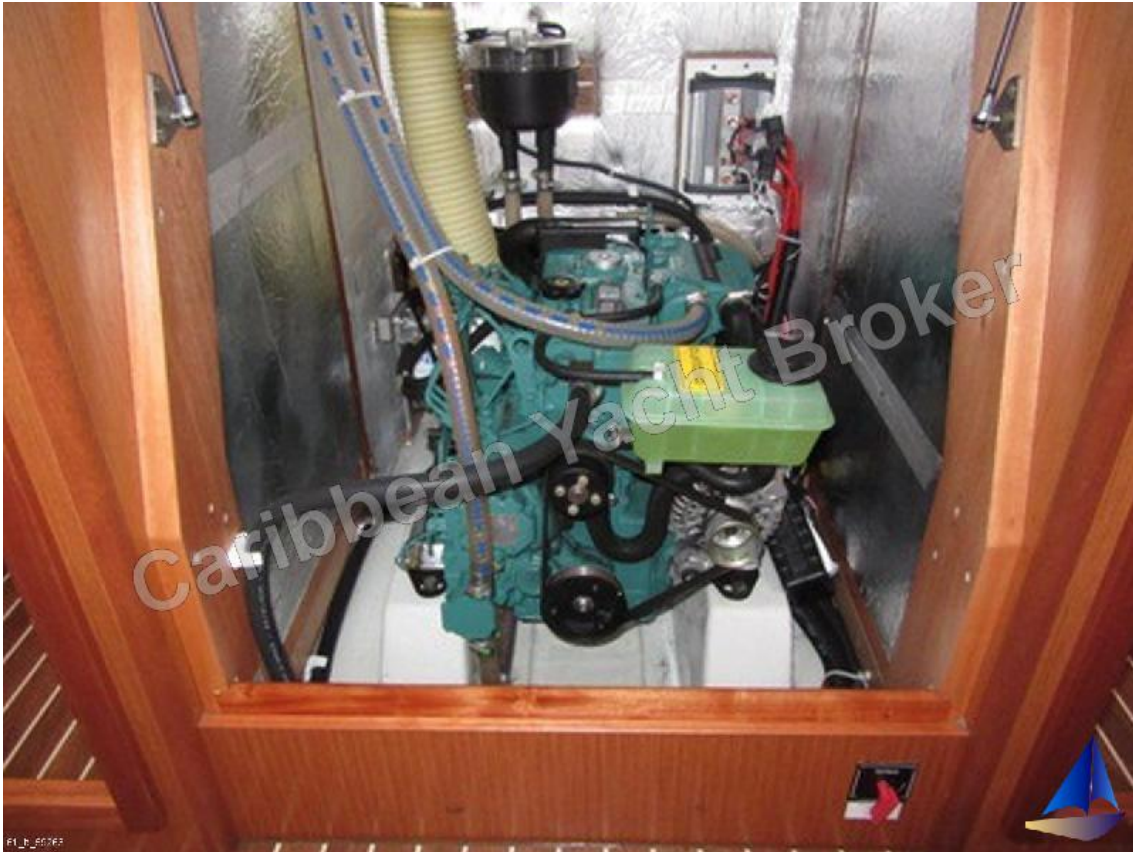
Layout / Bavaria Cruiser 37 - 2016