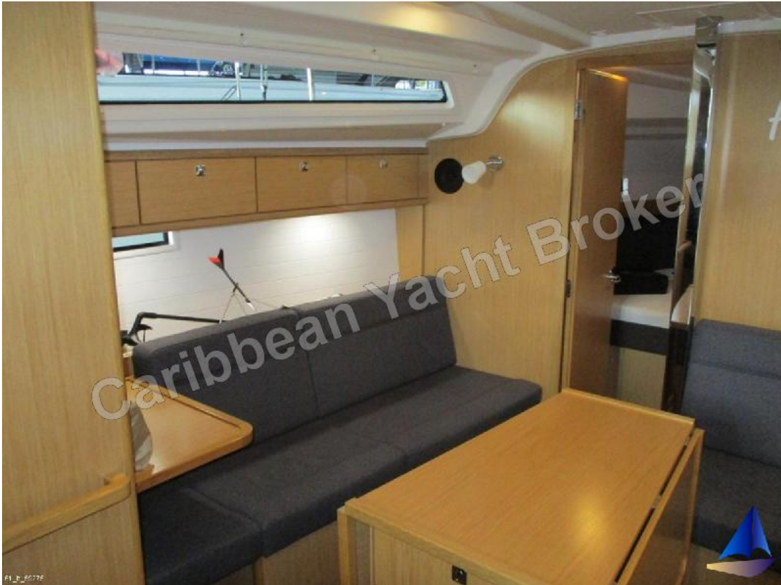
Navigation / Bavaria Cruiser 37 - 2016