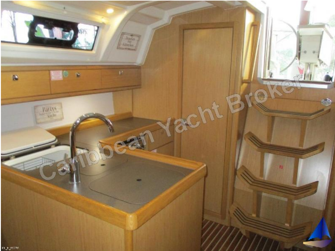
Cabin / Bavaria Cruiser 37 - 2016