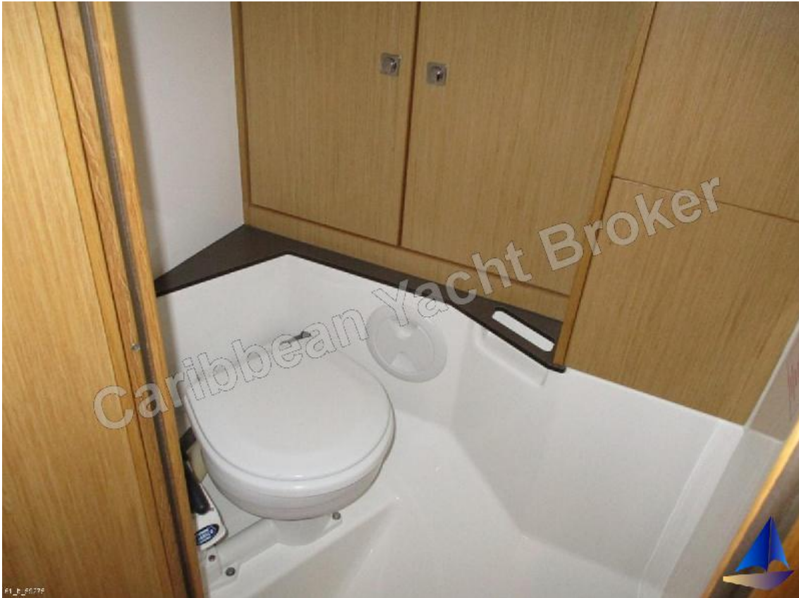
Layout / Bavaria Cruiser 37 - 2016