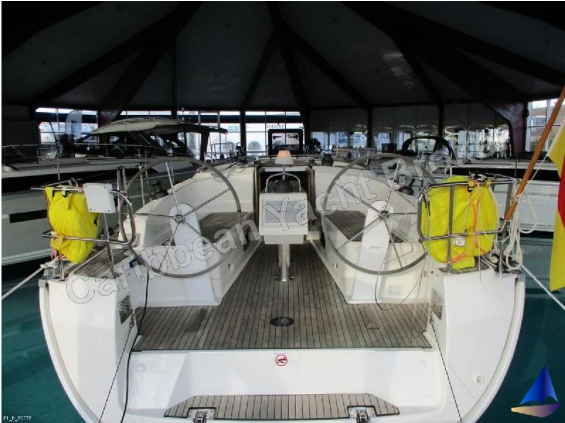
Bavaria Cruiser 37 - 2016