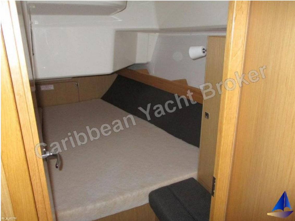
Bath / Toilet / Bavaria Cruiser 37 - 2016