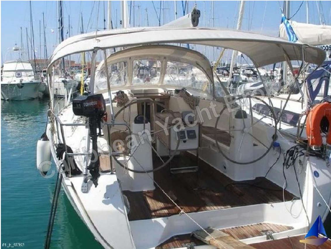
Salon / Bavaria Cruiser 40 - 2011