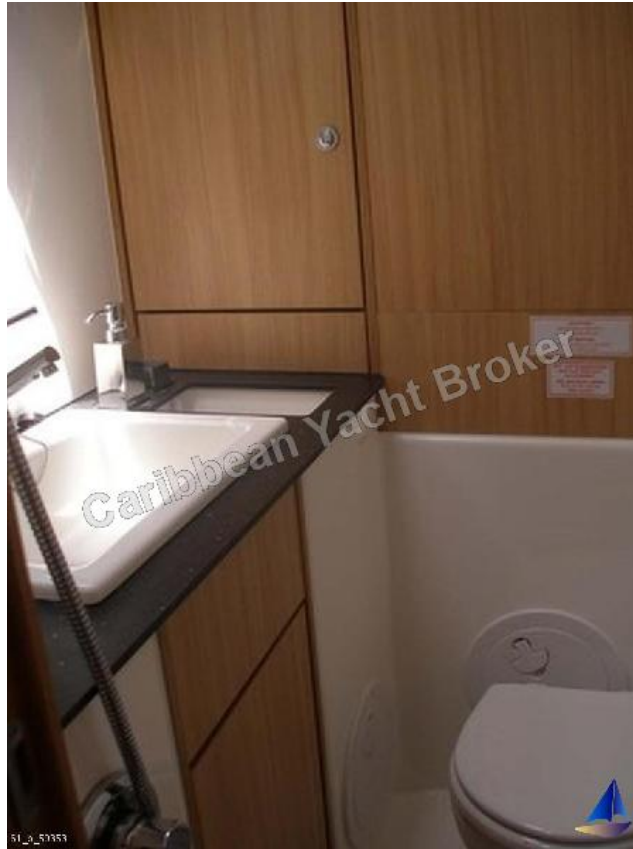
Layout / Bavaria Cruiser 40 - 2011