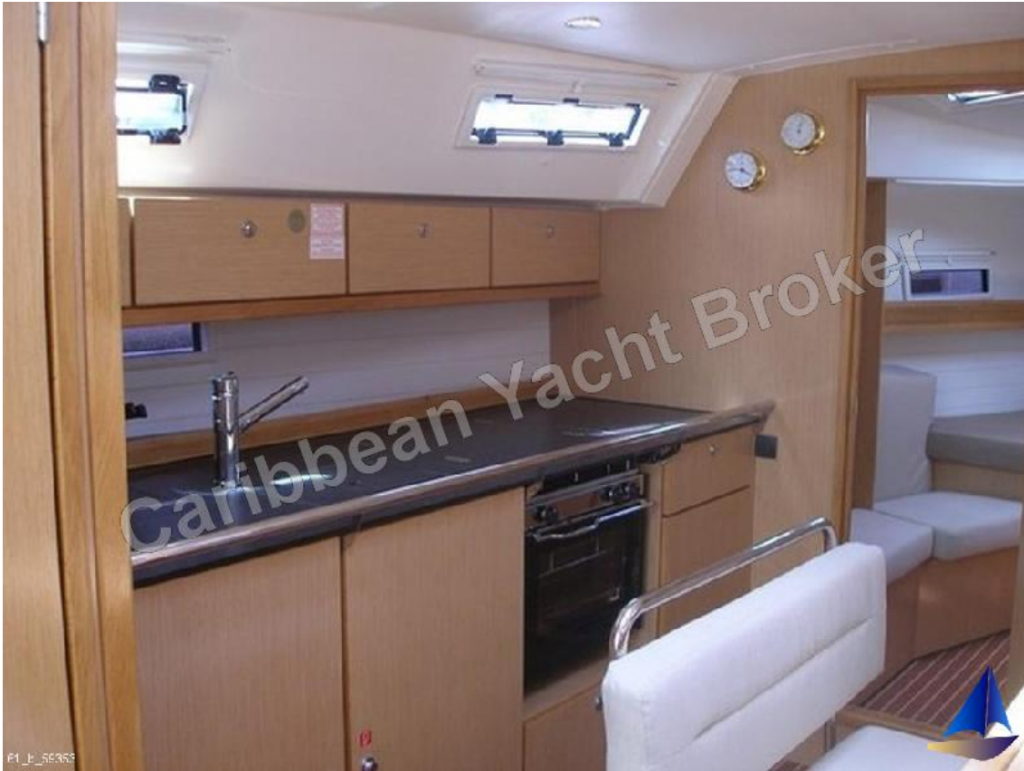
Navigation / Bavaria Cruiser 40 - 2011