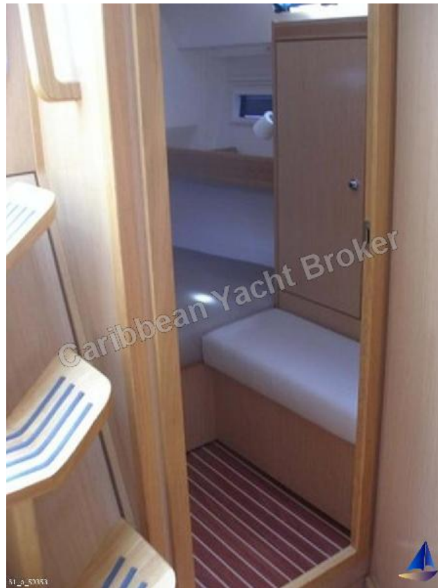
Bath / Toilet / Bavaria Cruiser 40 - 2011