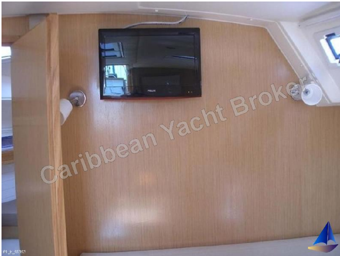
Cabin / Bavaria Cruiser 40 - 2011