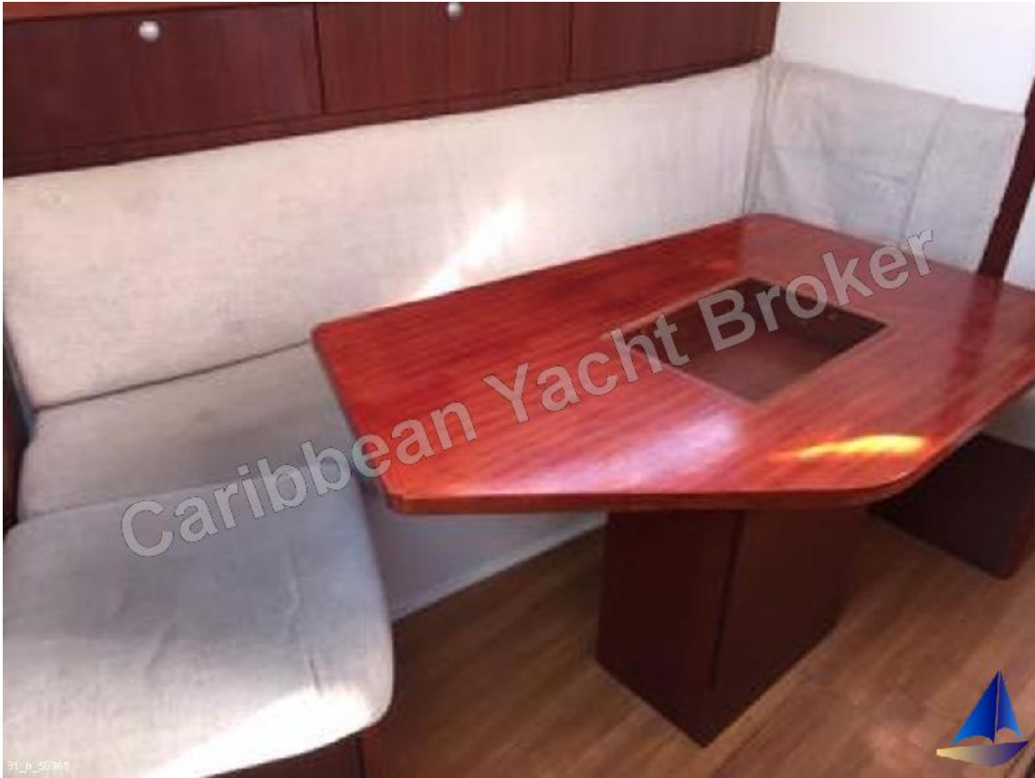
Navigation / Hanse 350 - 2009