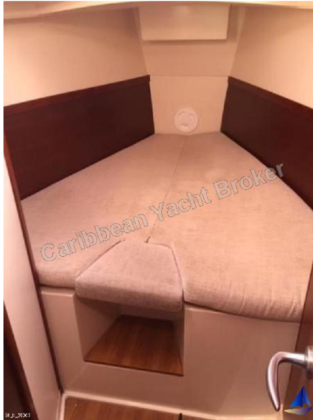
Cabin / Hanse 350 - 2009