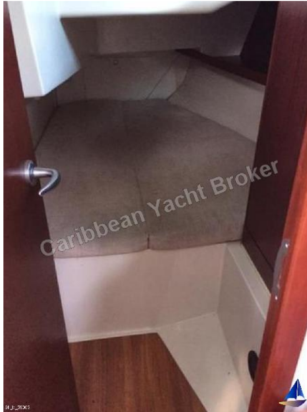
Bath / Toilet / Hanse 350 - 2009